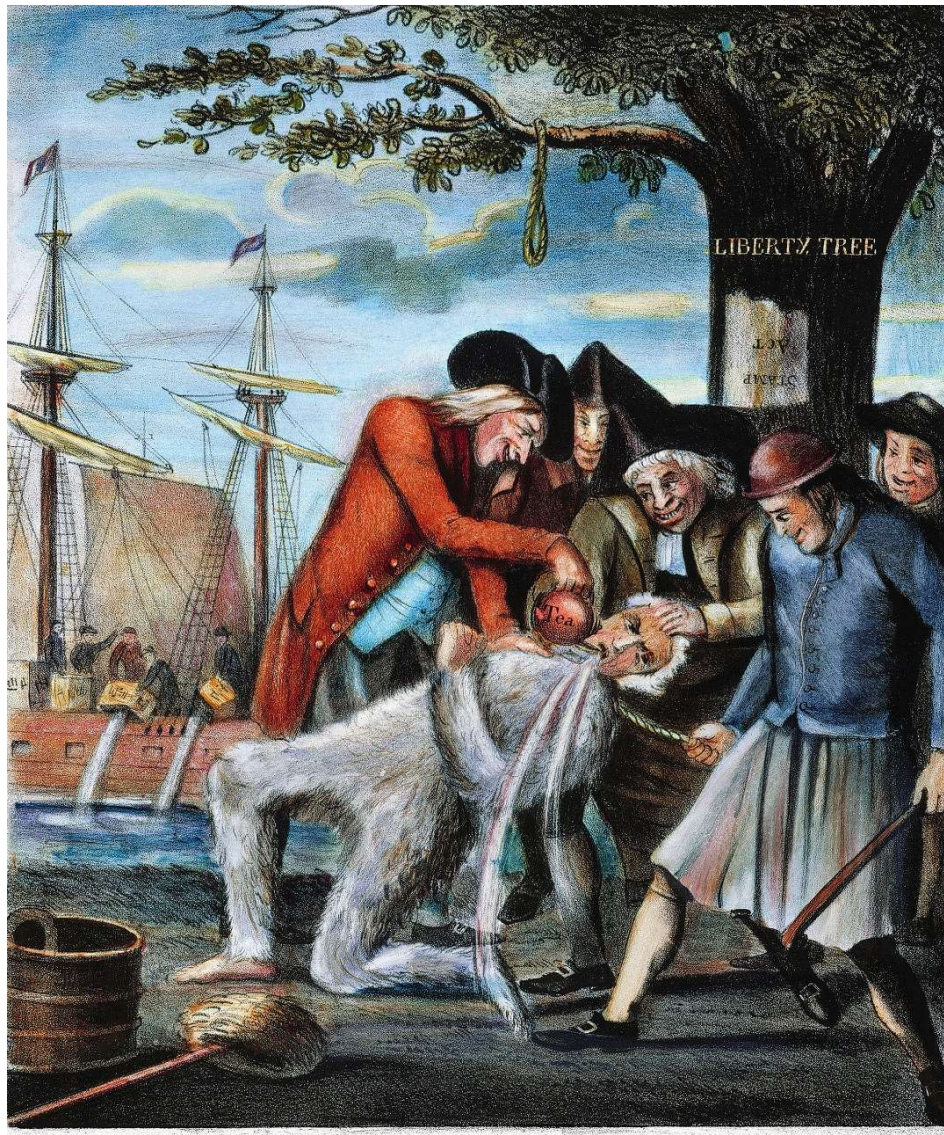
THE BOSTONIANS PAYING THE EXCISE-MAN OR TARRING & FEATHERING

Toelichting: Op 14 augustus 1765 werd de Britse ambtenaar die belastingen moest innen in de Noord-Amerikaanse havenstad Boston aangevallen door een groep kolonisten. Ze smeerden hem in met pek, plakten veren op zijn lichaam en lieten hem de goederen eten en drinken waarover zoveel belasting werd betaald. Vervolgens werd hij opgehangen aan een hoge boom. De boom kreeg als bijnaam de Liberty Tree (vrijheidsboom), waarna al snel ook in andere steden in Noord-Amerika vrijheidsbomen werden aangewezen als verzet tegen de Britse heerschappij in de Amerikaanse koloniën. Deze tekening is gemaakt in 1774, een jaar na de Boston Tea Party, en werd indertijd ruim verspreid onder de kolonisten.