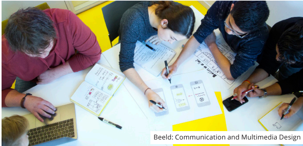
Beeld: Communication and Multimedia Design